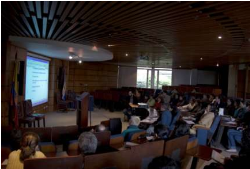
Un momento del curso sobre encabezamientos de materia