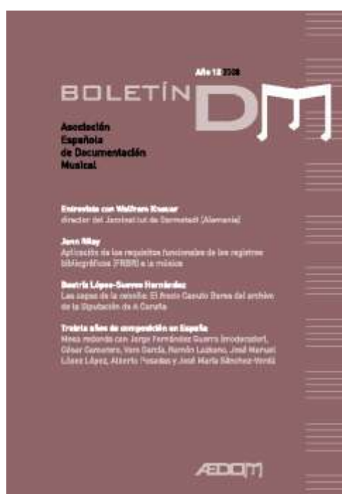
Cubiertas de los números 11 y 12 de Boletín DM