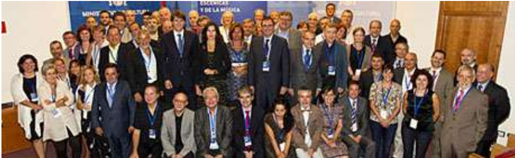
Pleno del Consejo Estatal tras su reunión en el Ministerio de Cultura

Autonomía—, un miembro de la Federación Española de Municipios y Provincias, y otro del Ministerio de Educación.